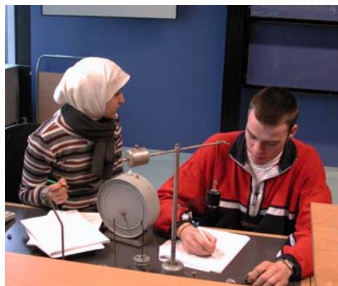
Leerlingen in het VWO Bovenbouwpracticum Natuurkunde aan het werk met de windtunnel bij een onderzoek naar het verband tussen luchtweerstand en snelheid (links) en bij een controle van de formule voor de centripetaalkracht (rechts).