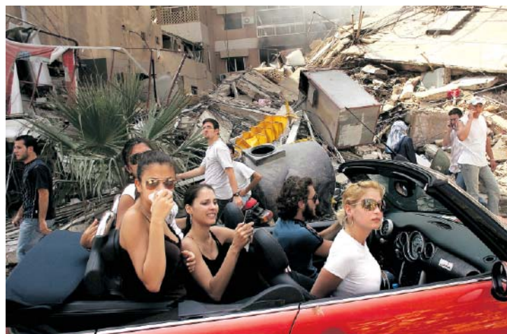
World Press Photo 2006.